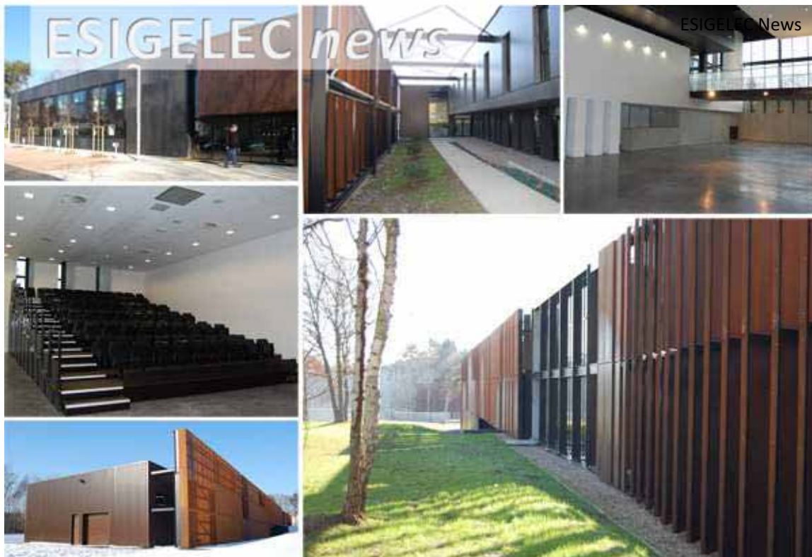
Le Campus Intégration Systèmes Embarqués inauguré en 2012

Nous autres Anciens, avons un devoir d'accompagnement envers nos jeunes successeurs comme eux-mêmes vis-à-vis de ceux qui les suivront. Sachons y penser !